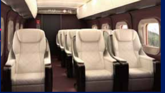
※2012年9月4日 JR 東日本及び JR 西日本プレスリリース資料より