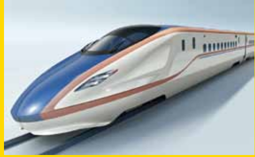
本画像は、東京～金沢間の運行を予定している車両です