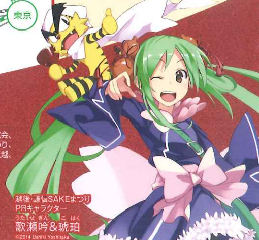
越後・謙信SAKEまつり PRキャラクター うたせきん こはく 歌瀬吟&琥珀 ©2014 Ushiki Yoshitaka

●20歳以上の年齢であることを確認できない場合には酒類を販売しません。 ●お酒は20歳になってからお飲みください。車を運転される方の飲酒は固くお断りします。お酒はおいしく適量にお飲みください。 ●イベントの内容・詳細は都合により変更される場合があります。あらかじめご了承ください。